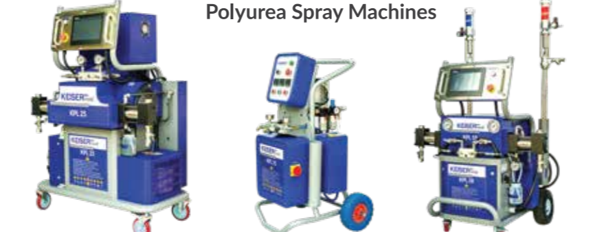
Polyurea Spray Machines