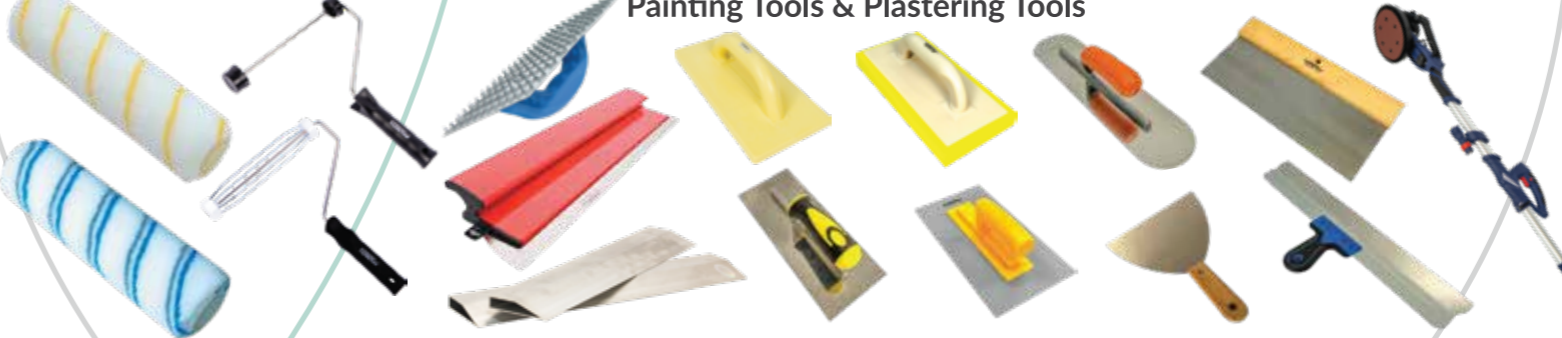
Painting Tools & Plastering Tools