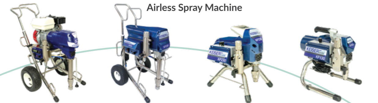
Airless Spray Machine