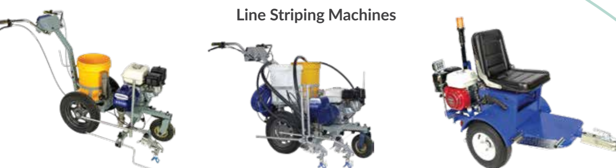
Line Striping Machines