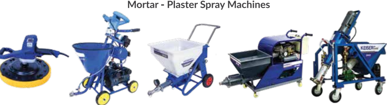
Mortar - Plaster Spray Machines