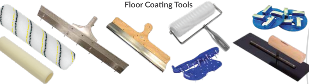
Floor Coating Tools