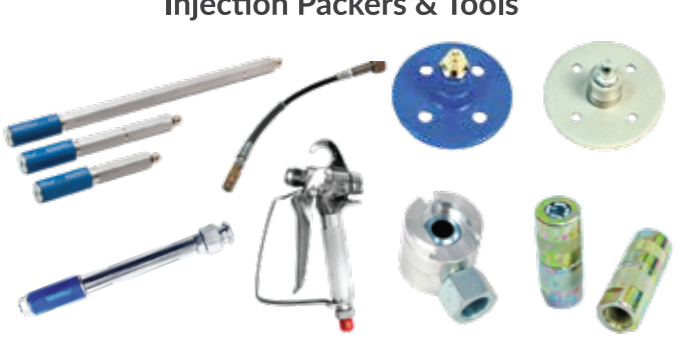
Injection Packers & Tools