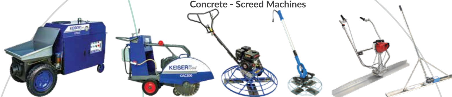
Concrete - Screed Machines