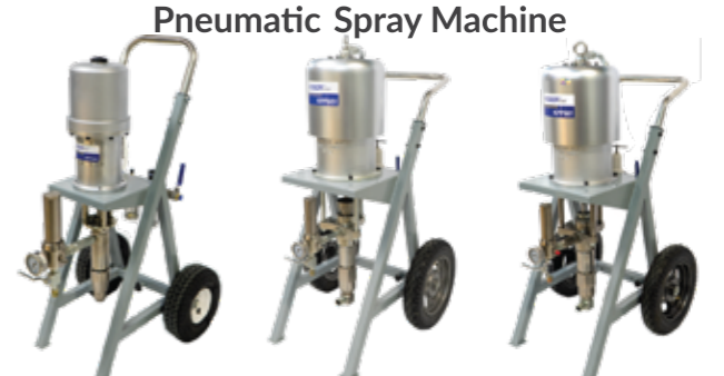
Pneumatic Spray Machine